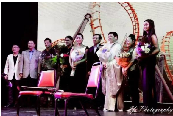
2015年，管亚东三重奏乐团与浦东派传人，国家一级演员林嘉庆同台演出，王文天大使，文化处赵海生公使衔参赞等出席，演出获得巨大成功。