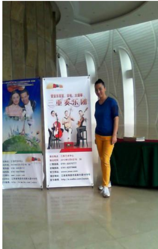
2014年 江西省艺术中心