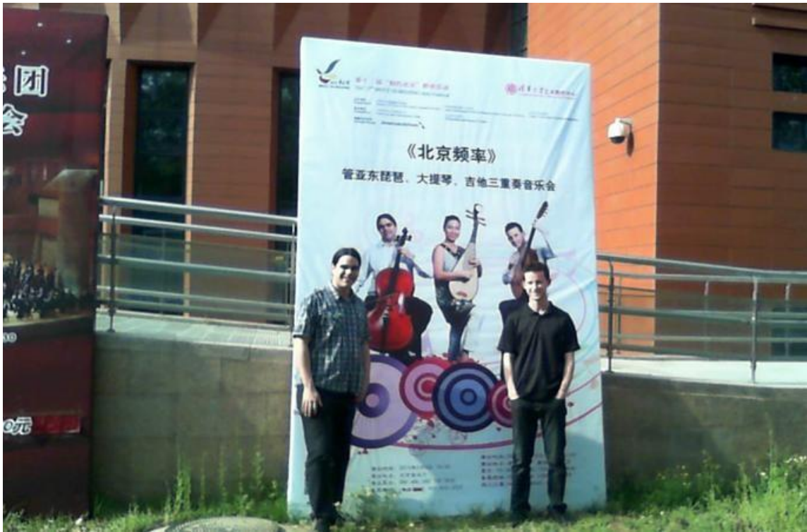
管亚东三重奏在清华大学蒙民伟音乐厅举办音乐会