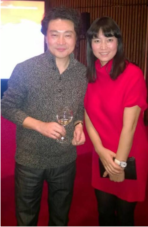
与小提琴演奏家吕思清