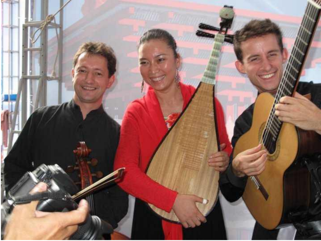
2010 年上海国际艺术节