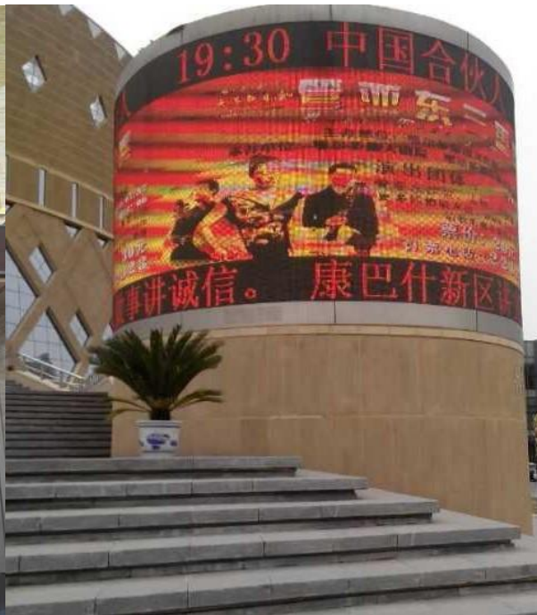
在国内的超级待遇