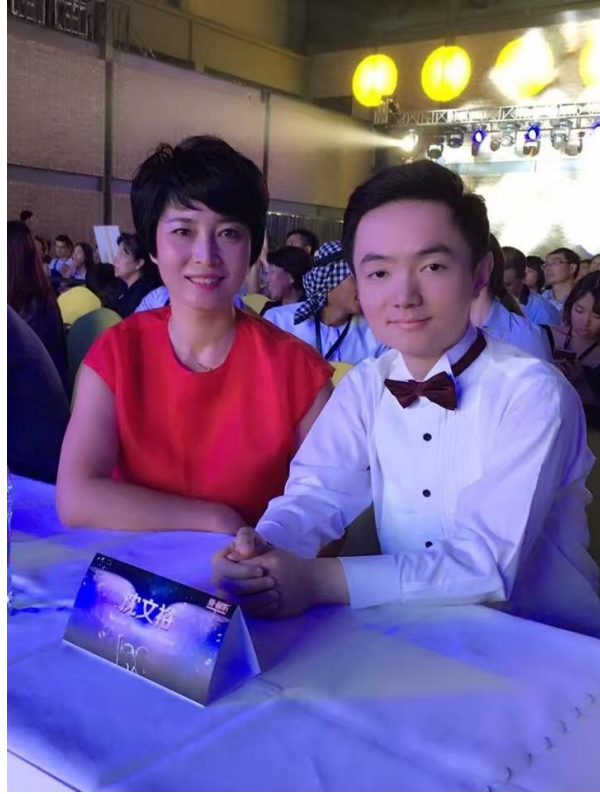
与钢琴演奏家沈文裕