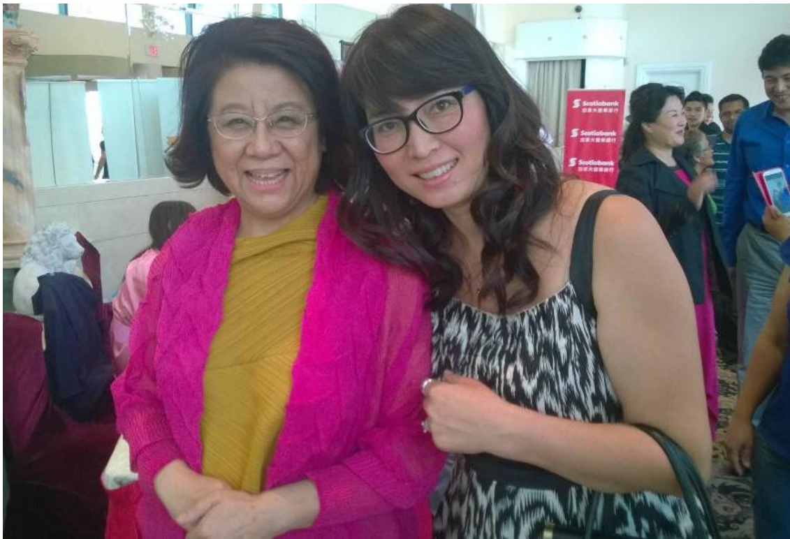
与《我要上春晚》的央视舞台上结识了著名导演姜乃鸣，梁宏达，大山。